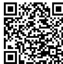
【申し込み用QRコード】

○右記のQRコードから申込フォームに必要事項をご入力いただき、送信してください。