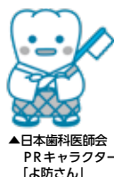
▲日本歯科医師会 PRキャラクター「よ防さん」

一方で、なかなか噛んでくれない子どもたちには噛む力を無理につけさせるのではなく、さまざまな食材に触れて、食べることに慣れてもらいましょう。また、いすに座って食事をする場合は両足裏を床につけるなど、身体を起こして食事をとるようにしましょう。