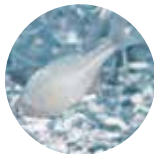
▲絶滅危惧種ニッポンバラタナゴ