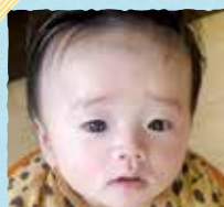
はくと伯飛ちゃん