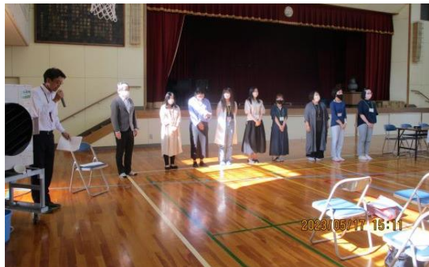
令和4年度役員 退任のあいさつ

P T A総会が5月17日に開催されました。昨年度の会計決算報告、今年度の会計予算、新役員の承認が行われました。新役員、新学級委員の皆様、P T Aの皆様よろしくお願いいたします。