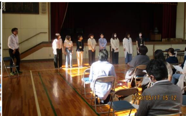
令和5年度役員 就任のあいさつ