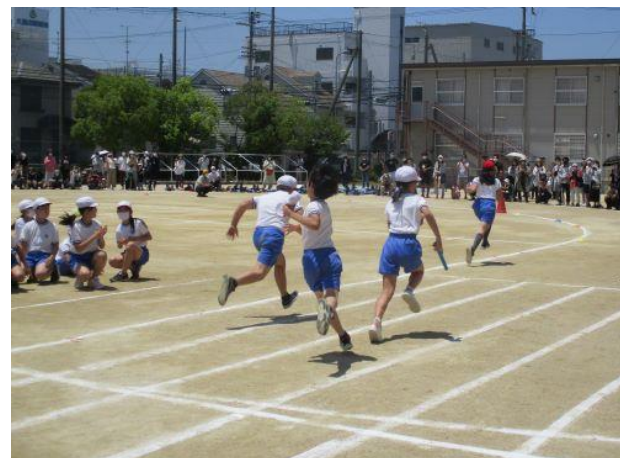
昨年度運動会の様子

お願いばかりになりますが、みなさんがお互いに気持ちよく観覧できるよう、譲り合ってください、案内させていただいたルールを守っていただきますよう、よろしくお願いいたします。