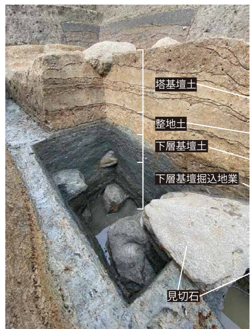
下層基壇掘込地業、見切石、下層基壇土、整地土、塔基壇土 (南から)