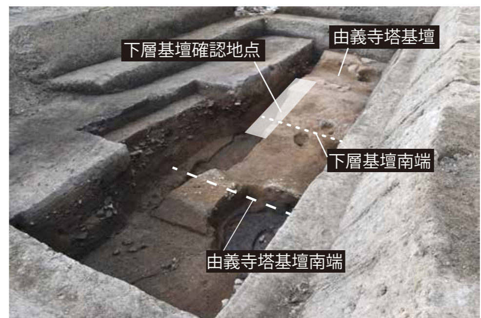
令和5年度調査区 (南東から)