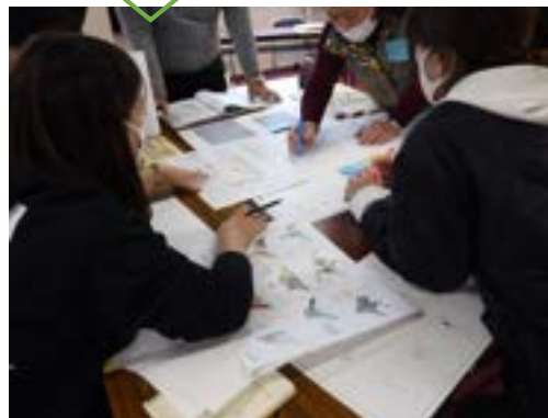
グループ発表の様子