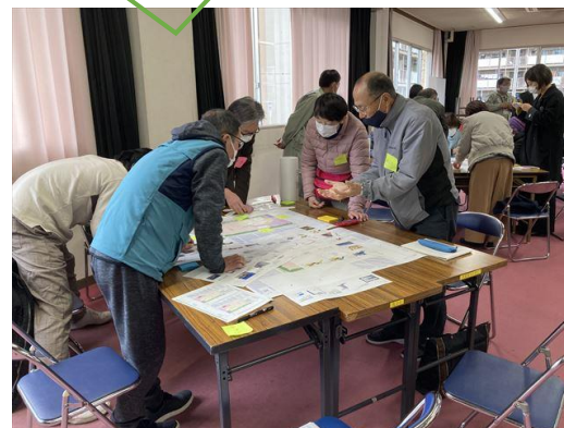
グループ発表の様子