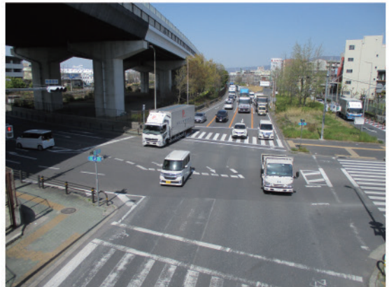
中央環状線府道佐堂交差点付近