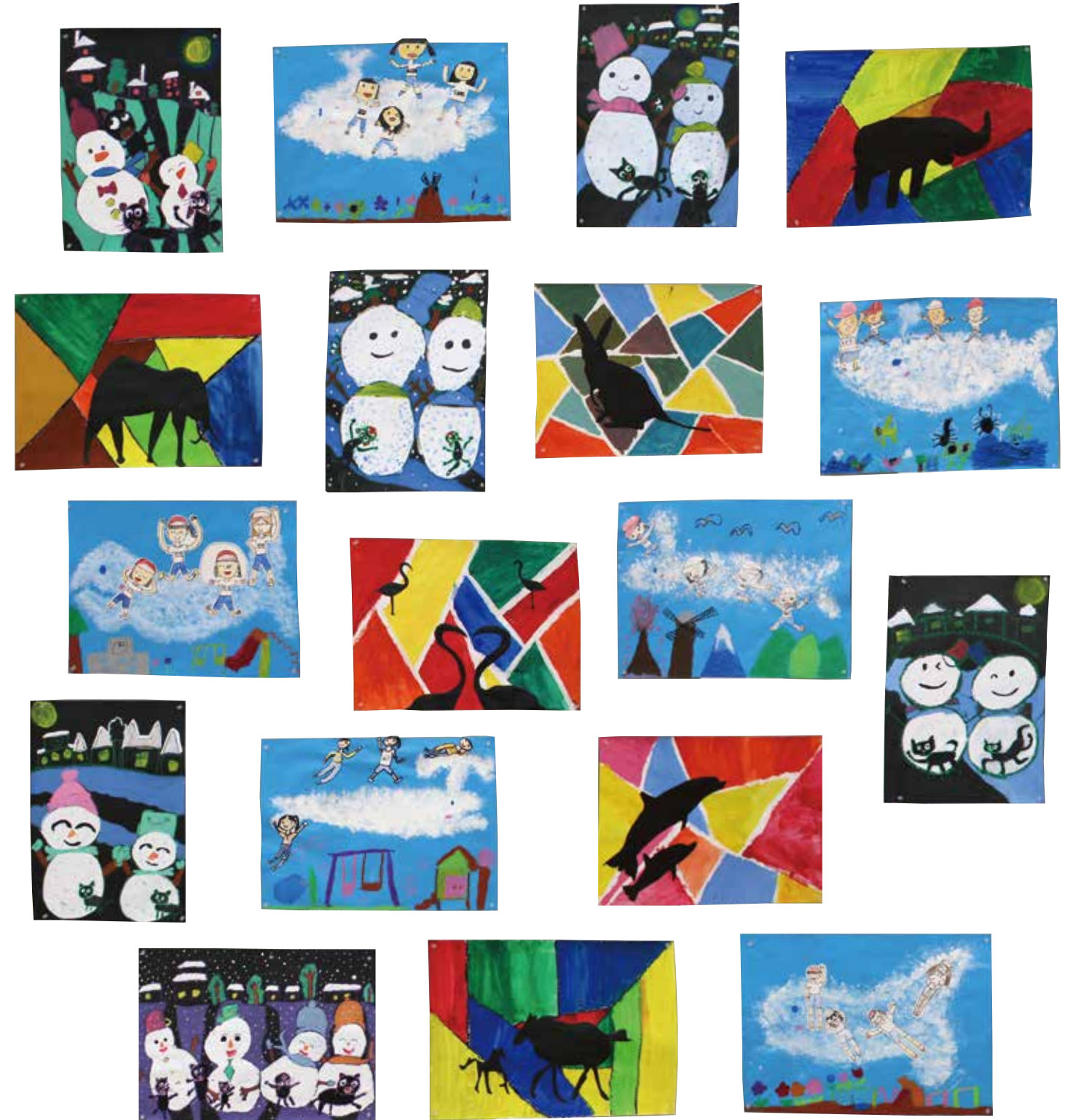
[龍華小学校児童 1年生～3年生の作品]

龍華小学校区では、平成25年に「龍華小学校区まちづくり協議会」が発足し、「子どもたちの笑顔があふれ いくつになっても暮らしやすいまち」の実現に向け、まちづくりを進めてきました。わがまち推進計画は、地域住民にとって一番身近な生活圏である龍華小学校区の課題を解決する、あるいは、長所や魅力を伸ばし、育てていくといった、地域住民のニーズに応じたきめ細やかなまちづくりを実現するため、龍華小学校区の自主的・自発的なまちづくり活動の指針として策定するものです。