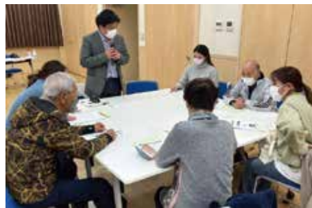
現在の地域活動の状況や課題等話し合いました。