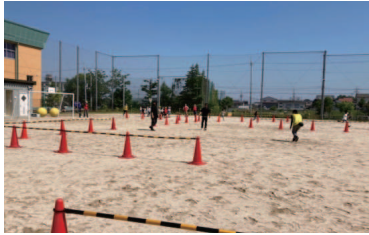
高安ミッション(支援)