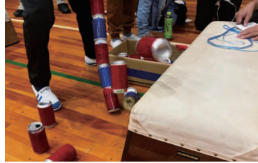
子どもオリンピック(支援)