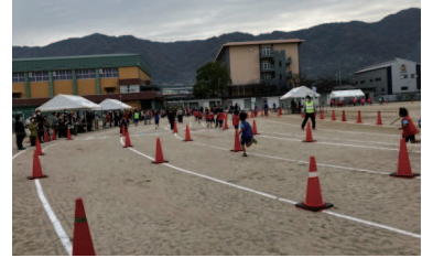
高安の里マラソン大会(支援)