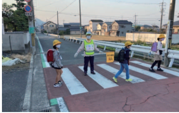
子ども見守り活動