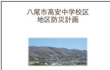
八尾市高安中学校校区 地区防災計画