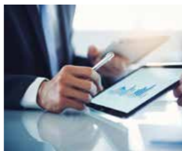
新やお改革プラン2.0にさらに取り組みの強化を図るべきものとして行政DXの推進という項目が追加される。

Q 超過勤務のあり方や働き方改革など各部署長がマネジメントを行い取り組んでいく必要がある。その観点から、AI・RPAの活用などスピード感を持つて進め、業務量の適正化に向けた事業のスクラップやゼロベースでの事業見直しなどを進めていく必要があると考えるがどうか。 A DXの推進を新やお改革プラン2.0に位置づけ行革の観点からもしっかりと進めていきたい。引き続き財源とマンパワーを生み出す行財政改革に取り組む、新たな市民サービスにつなげるように取り組んでいきたいと考えている。