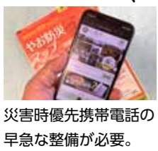
災害時優先携帯電話の早急な整備が必要。

Q ヤングケアラーの子どもたちを社会全体で守るための啓発や実態調査を通じ、一人一人に寄り添った支援ができるように、子どもたちに関わる部局が連携し合う推進体制を構築するなど、取り組みを強化するべきだと考えるがどうか。 A 本年度実施する小・中学生へのアンケート及び15歳から18歳を対象とした実態調査を通じて、ヤングケアラーの実態を把握するとともに、認知度の向上や子どもに関わる機関の連携・協力による支援策の充実を図っていく。 Q 家族が亡くなった際に必要な手続きがワンストップで受けられ、遺族の負担軽減につながる「おくやみコーナー」の設置が必要だと考えるがどうか。 A 遺族が行う各種手続きの負担軽減に一定効果があるものと認識しており、他市の事例を参考に、本市に適した手法を、部局で連携しながら調査研究していく。