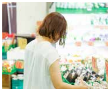
令和5年4月の全国消費者物価指数は、前年同月比で生鮮食品等の多くの費目で上昇している。

介護保険事業計画に認知症施策を位置づけており、認知症の方の意見は同計画策定の際のアンケートから反映していく。認知症施策推進計画は必要に感じ検討していく。 Q ①空港西側跡地の開発、②国道25号大阪柏原バイパスの整備、③近鉄河内山本駅の高架化・立体交差化を進めるべきだが状況は。 A ①は都市計画の手続きを進め、決定後に売却する予定である。②は国道の課題やバイパスの必要性を国交省に説明している。関係機関と連携し取り組んでいく。③は大阪府や近鉄と連携し、事業の必要性・事業効果等を研究していく。