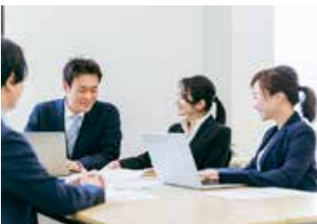
高い市民サービスを維持するためには職員の向上心が重要となっている。