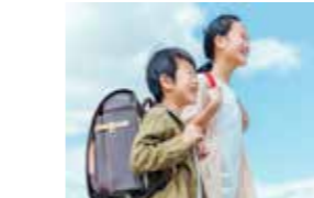
八尾市の新しい就学制度がスタートした。