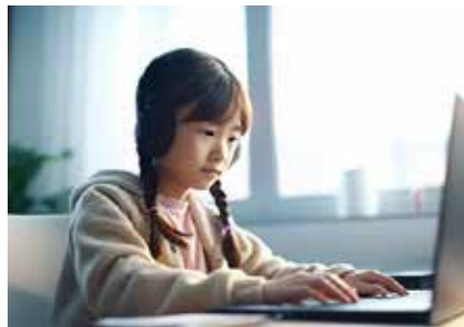
ICTを活用したオンラインでの学びや居場所づくりが求められている。

A 件数は100件程度、年齢はこれまで手紙等での相談の少なかった小学校高学年から中学生の相談を想定している。