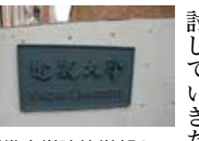
近畿大学建築学部との連携に関する協定を締結し今年度で10年目となる。