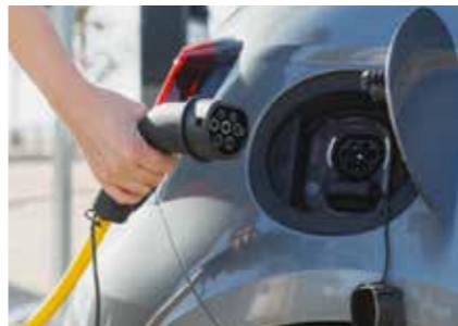
電気自動車等の今後の普及が見込まれる。

Q 電気自動車等を充電するため急速充電設備のうち、現在は変電設備として取り扱われている全出力が200キロワットを超えるものについて、条例改正により急速充電設備として取り扱うとのことだが、変電設備設置業者へはどう周知するのか。 A 急速充電設備が設置されている多くが車のディーラーや大型商業施設の駐車場等であり検査や設置相談の際に、注意喚起や案内をしていきたい。