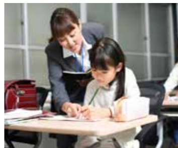
教員の資質向上や負担軽減など、学校現場における様々な課題がある。

Q 給食費の無償化のみならず、教員が不足する学校への教員の配置や教員の働き方改革、資質向上などの学校現場が抱える課題と並行して、解決に向けた取り組みを進めるべきだと考えるがどうか。 A 学校現場の課題は認識しており、府や国に要望するとともに、新たな教員を配置することや、その有効性の検討も含めて、市長部局と教育委員会が一体となった取り組みを進める必要がある。 Q 人口減少を見据えた市政運営の展望や対策はどう考えているのか。 A 限られた経営資源の中でAIやRPAなどの新技術の活用や