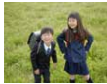
マスクの着用を求めないことを基本としながら学校生活を送るよう取り組んでいる。

Q 子どもへのワクチン接種は、申請方式やホームページでの副反応の周知などの慎重な対応が必要だと考えるがどう対応しているのか。 A 小児・乳幼児も含めた今後の接種券の発送については、国や他の自治体の動向を注視し対応していく。また、ワクチンのメリットと副反応のデメリットを理解してもらえよう情報発信に努めていく。 Q 羞恥心等の精神的な理由でマスクを外せない子どもへの対応は。 A 寄り添った指導を粘り強く行い保護者への周知も含め取り組みを進めている。 Q 郷土愛を育むための教育はどう行っているのか。 A 児童・生徒の発達段階に応じた徳科を含め教育活動全体を通して行っている。