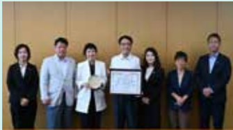
議会だより編集委員会 委員