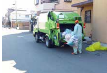
可燃ごみ等の収集の民間委託は、今後、仕様書を詳細に作成し、業者選定を行う。

Q 新生児聴覚検査の費用助成と、3歳6か月児健康診査の視覚検査に屈折検査を導入するとして、1050万円増額するが、事業開始はいつからか。また、これらの事業を実施する理由は。 A 令和5年10月1日以降生まれの子を対象に始める予定である。新生児聴覚検査は先天性難聴を早期発見し、療養につなげるもので、経済的負担の軽減により検査を受けやすくと考えている。また、屈折検査の導入では、弱視を早期発見し治療や療育につなげたいと考えている。