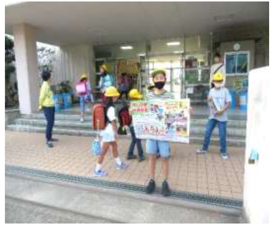
ハロウィン大会 児童が先生からのクイズに答えてシールを集めました