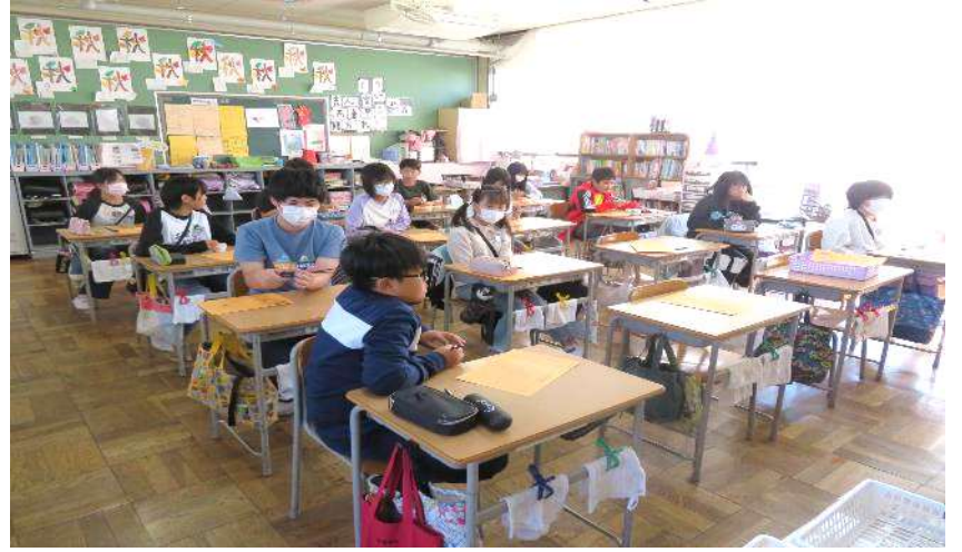
児童会主催 赤い羽根の募金運動