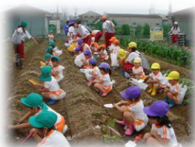
じゃがいも・玉ねぎ掘り

食育指導 —— 畑で様々な農作物を育て、食べ物への興味を深めています。 (苗を植えて収穫をし、おやつや給食で食べます)