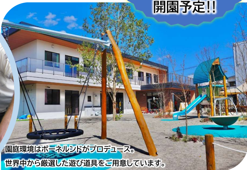
園庭環境はボーンネルシドがプロデュース。 世界中から厳選した遊び道具をご用意しています。