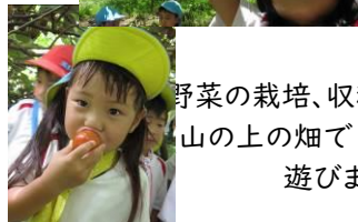
野菜の栽培、収穫(山の上の畑で遊びます)