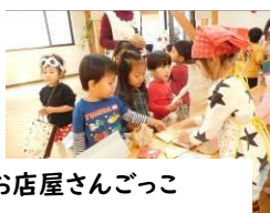
お店屋さんごっこ