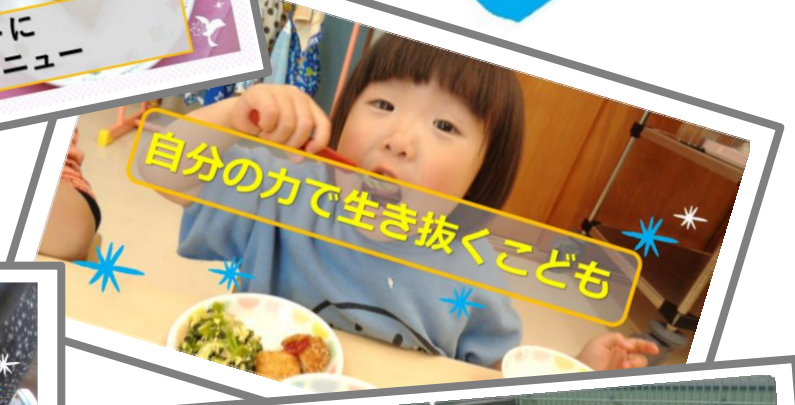
自分の力で生き抜くこども

くじらんち より多くの食にふれ、 「生きる」礎を築く食を 通して、日本・世界に関 心をもつ