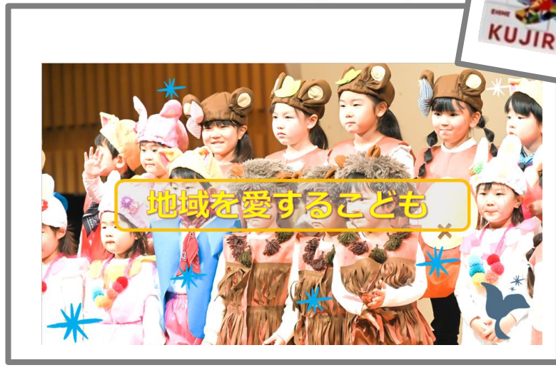
地域を愛するこども