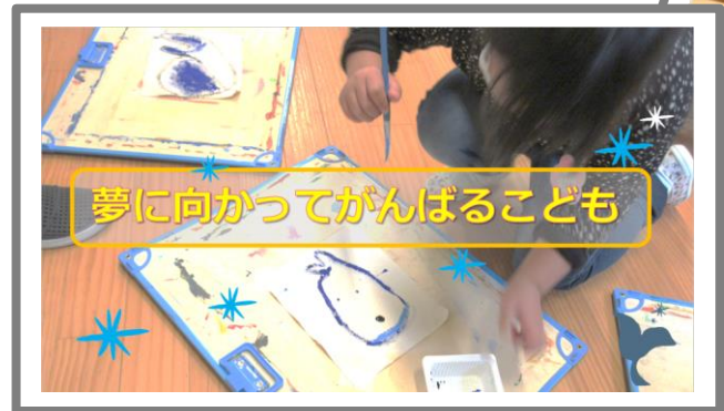
夢に向かってがんばるこども