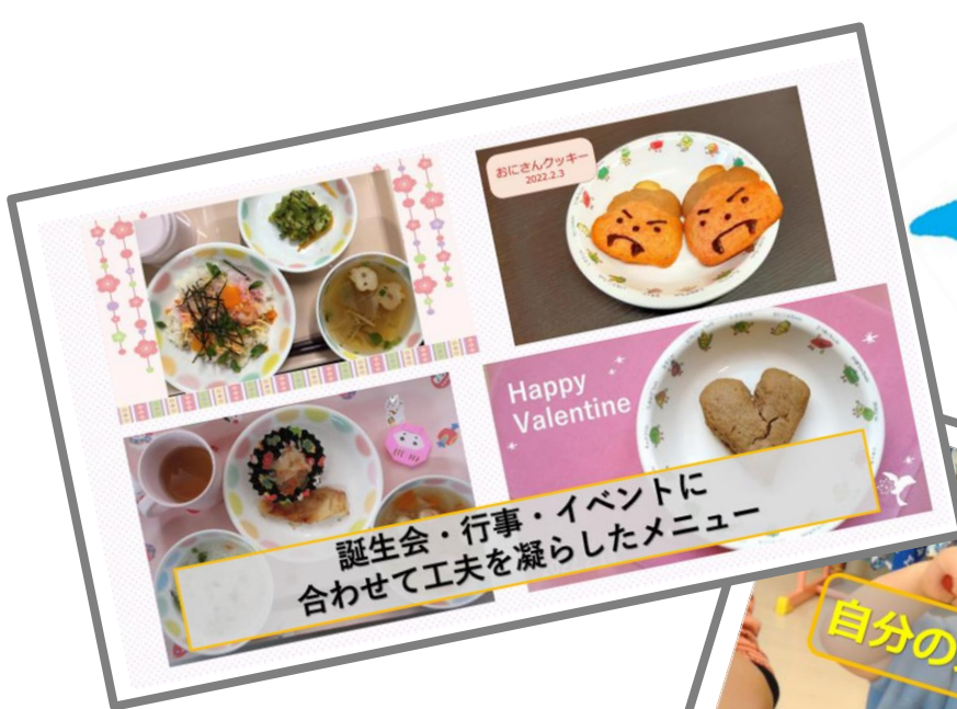
誕生会・行事・イベントに 合わせて工夫を凝らしたメニュー