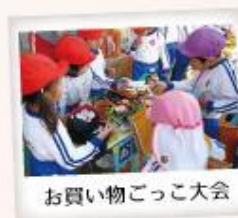
お買い物ごっこ大会