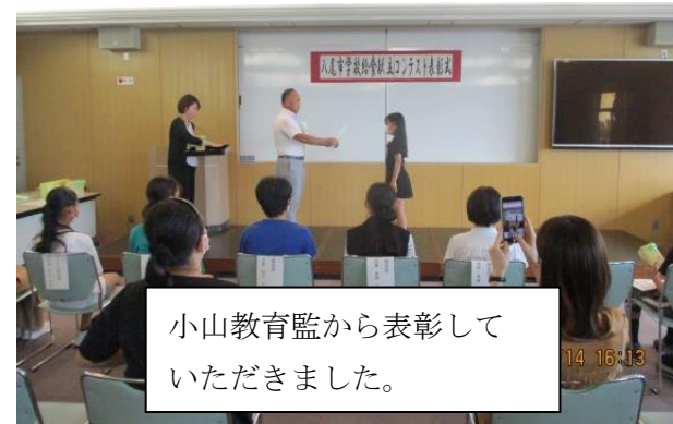
小山教育監から表彰していただきました。

2人の献立は3学期給食に出る予定ですので、どんな給食が出るか、みなさん楽しみにしておいてください。