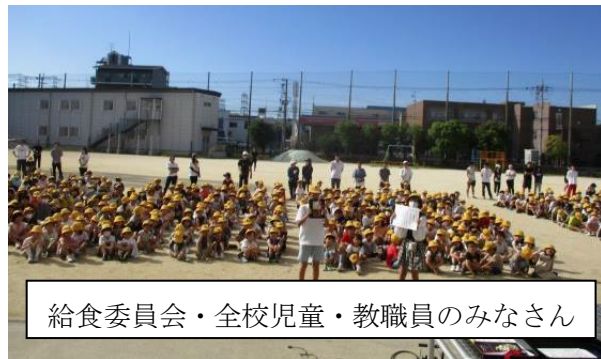
給食委員会・全校児童・教職員のみなさん

本校の、食育や給食の取り組みが大阪府の学校給食優良学校に選ばれました。児童、保護者、教職員、給食調理員の皆様に対しての表彰です。