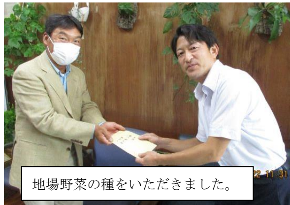
地場野菜の種をいただきました。