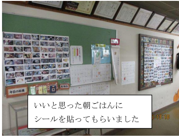
いいと思った朝ごはん にシールを貼ってもらいました

夏休みに作った朝ごはんの写真から、6年生と教職員が投票し、食べたい朝ごはん、自分でも作ってみたい朝ごはんが選ばれました。