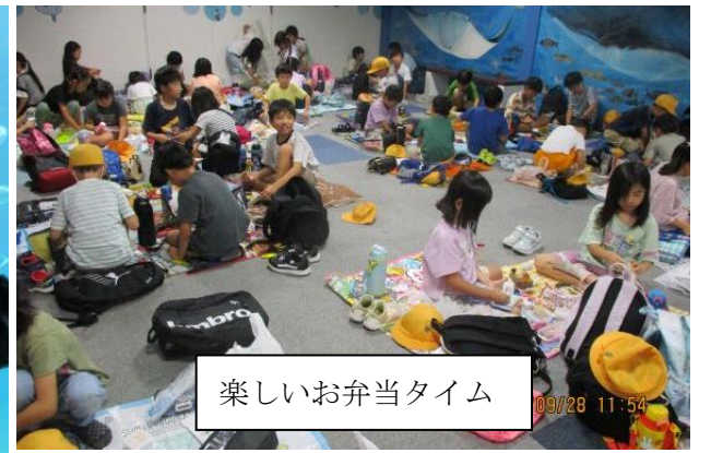
楽しいお弁当タイム