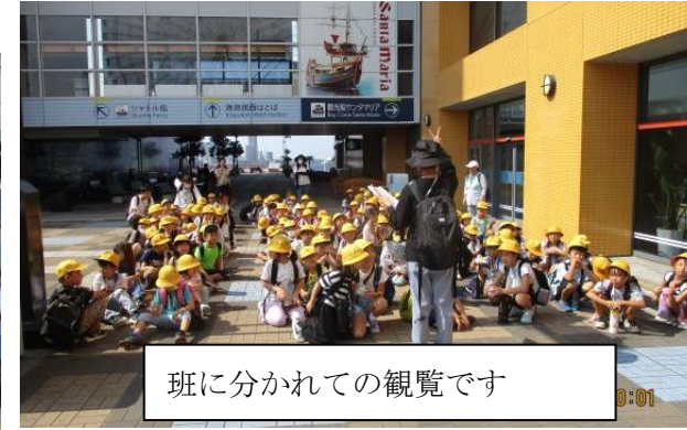
班に分かれての観覧です