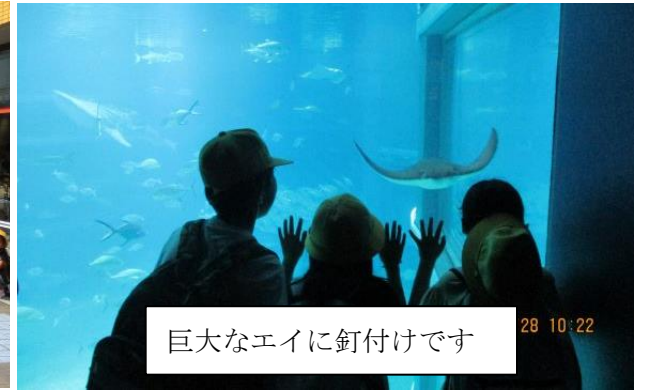
巨大なエイに釘付けです