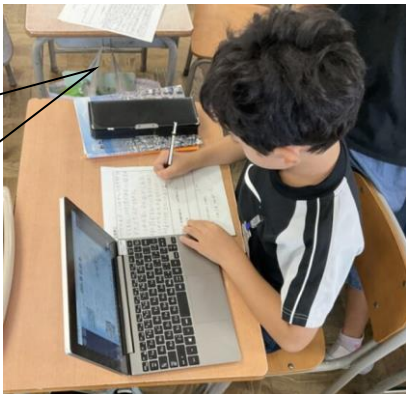
必要な情報は メモをとろう！