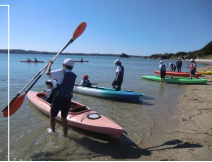
掛け声を合わせ漕ぎました