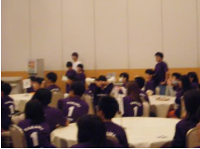
ビュッフェの夕食