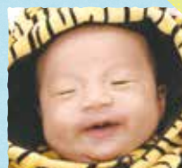
たいが 太牙ちゃん