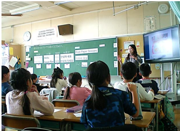
▲給食の写真を見て、どこの国の料理か考えている様子。(2年生)

世界には、色々な国があります。日本で私たちが当たり前だと思っていることは、ほかの国では違うかもしれません。これからも、色々な事に興味を持ち、知っていきましょう。お互いをすることはきっと、世界の平和にもつながります。