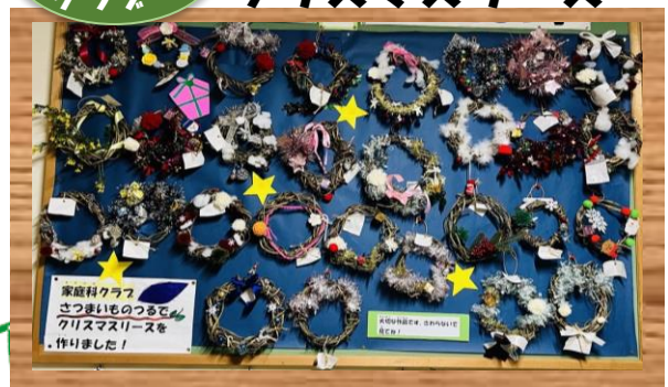
さつまいものつるを使って、素敵ナリースができました。