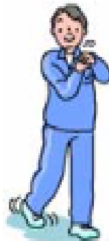
⑦手首・足首の回旋