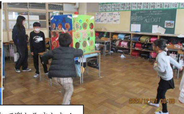
出し物に、みんなで楽しみました！