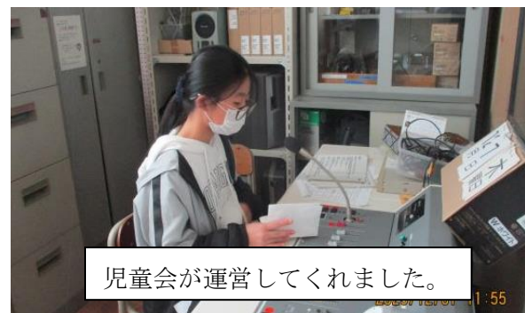
児童会が運営してくれました。