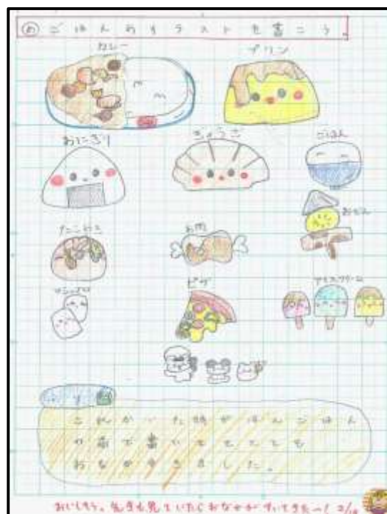
ご飯のイラストをかこう

赤ちゃん調べ 赤ちゃんは、生まれてから1歳未満の子供を指す。赤ちゃんは、成長が早く、好奇心が旺盛で、愛嬌がある。赤ちゃんの成長は、親にとって大きな喜びであり、責任でもある。