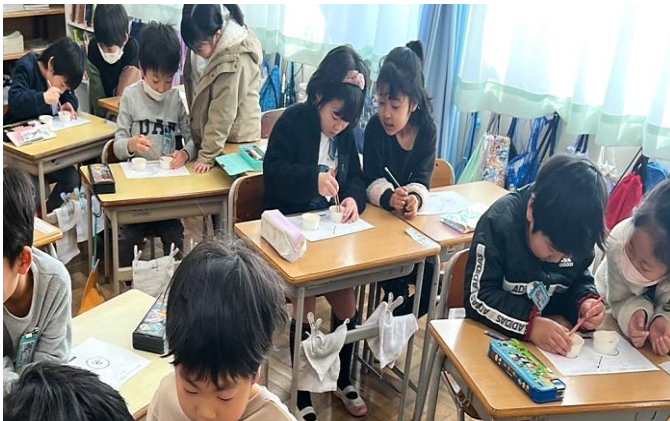
▲1年生のおはし検定のようす

はしもちかた いしき れんしゅう 箸の持ち方は、意識して練習すればするほど、うまくなります。食べる時や教室にある「おはし検定セット」で遊んで、みんなでうまくなろう。