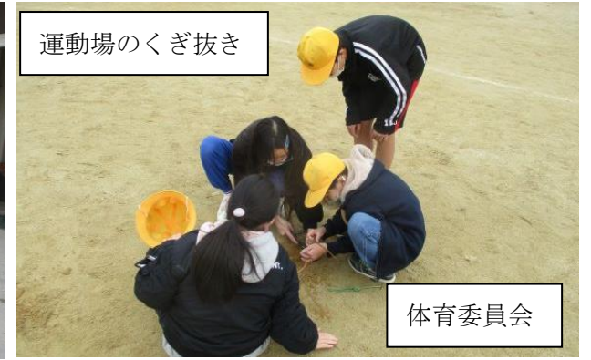
運動場のくぎ抜き