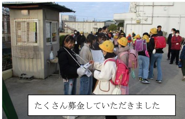
たくさん募金していただきました