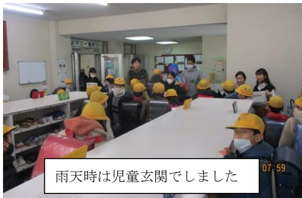
雨天時は児童玄関でしました