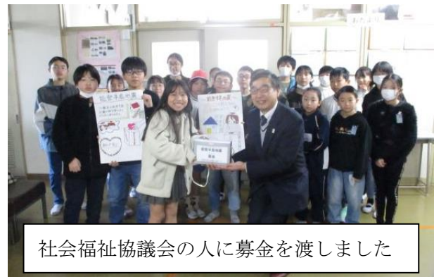
社会福祉協議会の人に募金を渡しました