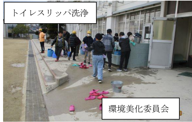
トイレスリッパ洗浄