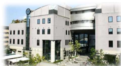
こども総合支援センター ほっぷ (八尾市)