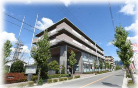
サポートやお (社会福祉法人 八尾隣保館)