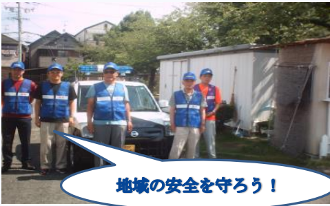
地域の安全を守ろう！