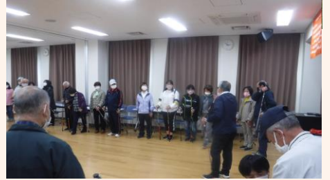
ノルディック・ウォーキング♪