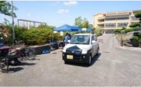
青色防犯パトロール