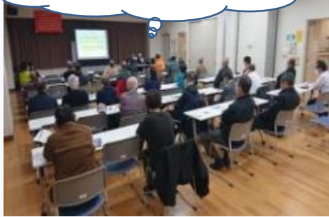
青パト隊員講習会