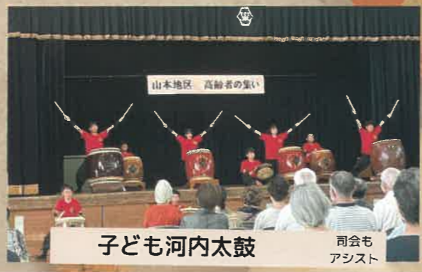
子ども河内太鼓 司会もアシスト