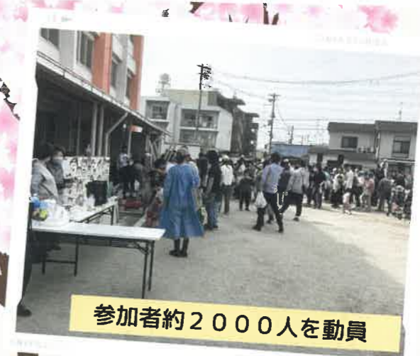
参加者約2000人を動員