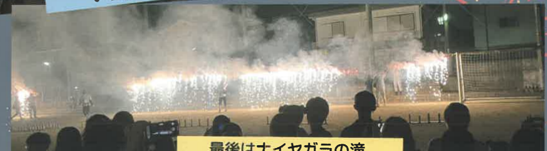
最後はナイヤガラの滝