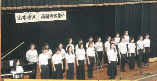
ハミール 名前の由来はハーモニコーとハミる