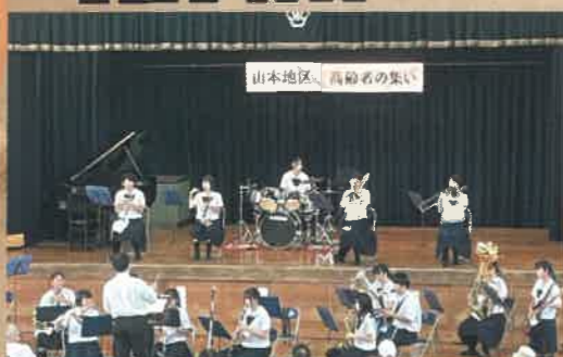
山本高校吹奏楽部 今年金賞獲得

今年は初の南京玉すだれ協会の方々をお招きして数々の技を御披露頂きました。高齢者だと思えば誰でも参加できる会と言うことで、小さいお孫さんと一緒に参加されている方も見受けられました。とても年齢層が広い会となりました。何歳でも参加可能なので皆さんどんどんご参加下さい。