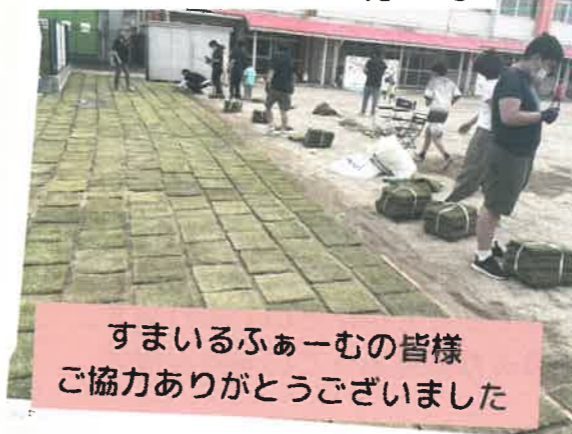
すまいるふぁーむの皆様 ご協力ありがとうございました