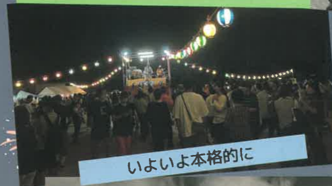
いよいよ本格的に