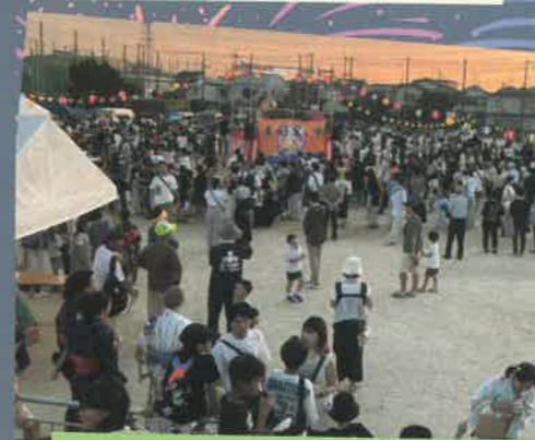
のべ約3000人に参加頂きました