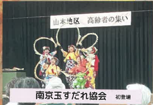
南京玉すだれ協会 初登場