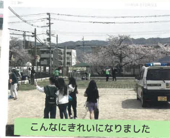
こんなにきれいになりました