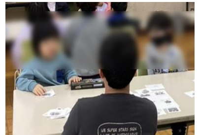
みんなで話し合い、モンスターを助けるアイテムを考えました。